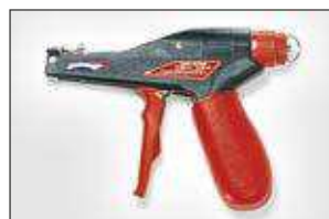
MK9HT. ver pag 556