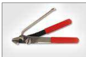
MTT4. ver pag 562