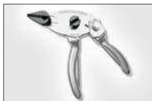
HDT16. ver pag 560