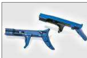
MK20, MK21. ver pag 549