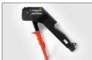
MST6. ver pag 561