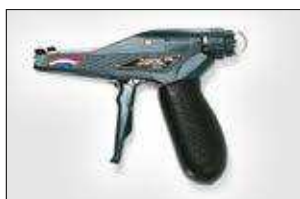
MK7HT. ver pag 553