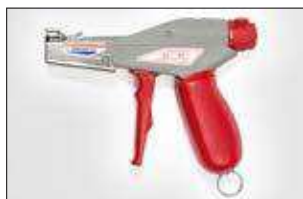
MK9SST. ver pag 559