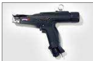
MK9P. ver pag 557