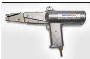
KR8PNSE. ver pag 558