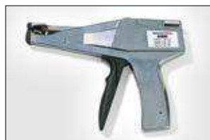
MK3SP. ver pag 550