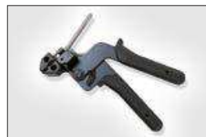
KST-STG200. ver pag 560