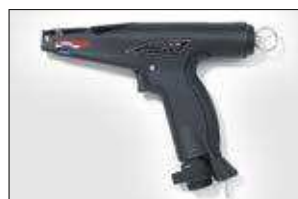
MK7P. ver pag 554