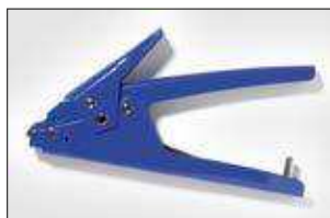
MK10-SB. ver pag 549