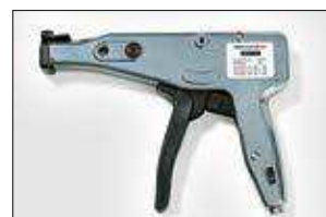
MK6. ver pag 555