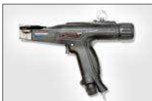
MK9PSST. ver pag 559