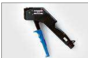
MST9. ver pag 561