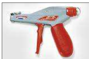
MK9. ver pag 555