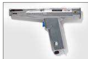
MK3PNP2. ver pag 550