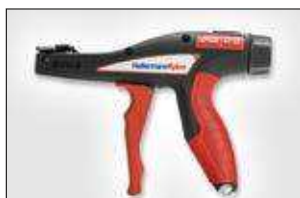
EVO9/EVO9SP. ver pag 551