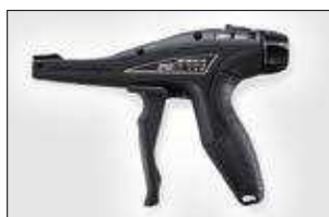
EVO7 ja EVO7SP. ver pag 551