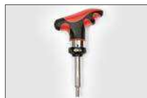
THT. ver pag 562