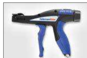
EVO9HT. ver pag 551