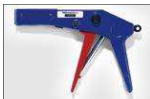
KR6/8. ver pag 558