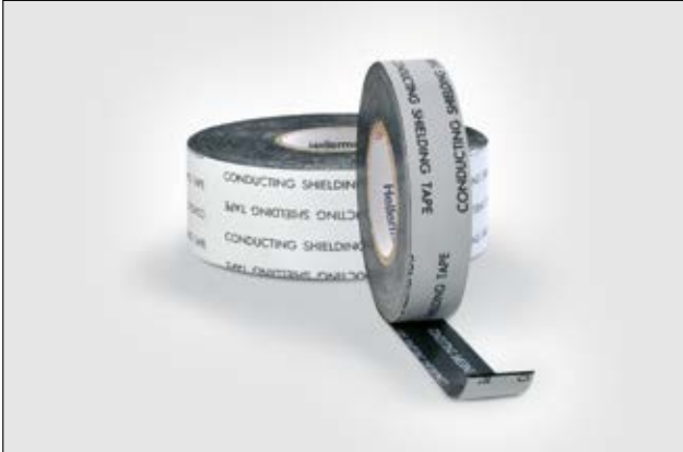
HelaTape Power 310 automalgamante es una cinta conductiva para el apantallado de terminales y empalmes de alta tensión.