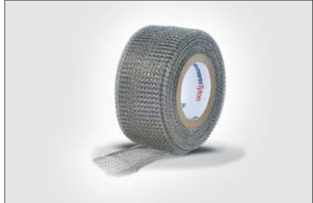
HelaTape Shield 320 proporciona un buen blindaje electromagnético.