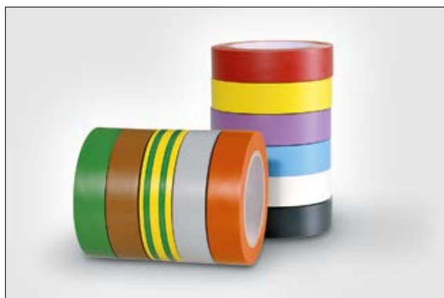
HelaTape Flex 15 es una cinta aislante de grado comercial y resistente a la intemperie.