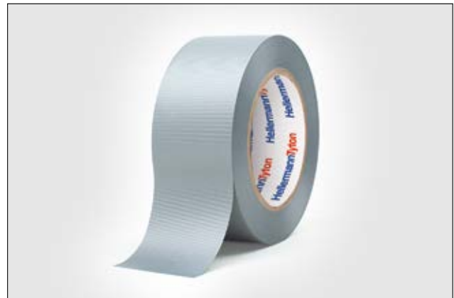
HelaTape Allround 1500 - Cinta multiusos fabricada de vinilo fuerte.