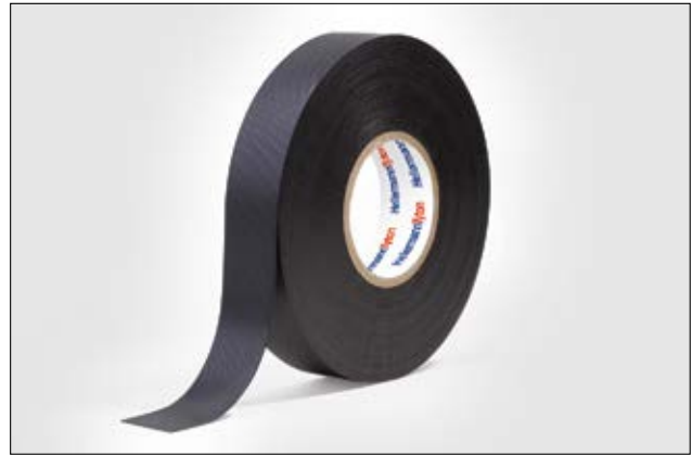
HelaTape Power 700 es una cinta autoamalgamante de caucho de media tensión.