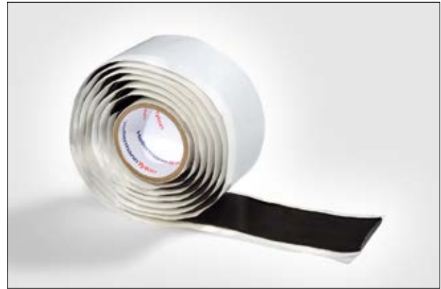
HelaTape Power 650 de masilla autoamalgamante de alta flexibilidad.