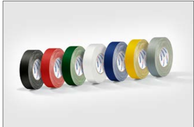
HelaTape Tex está disponible en diferentes tamaños y colores.