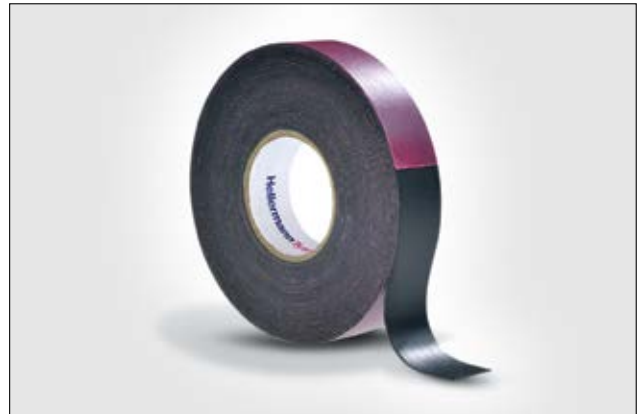
HelaTape Power 600 es una cinta autoamalgamante de caucho de baja tensión.