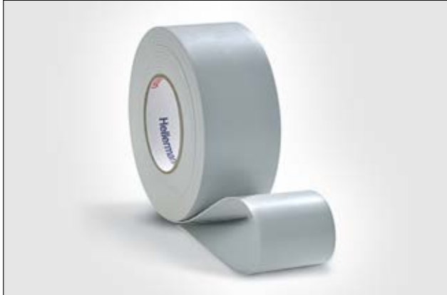
HelaTape Power 410 es una cinta elástica sin soporte no adhesiva, usada para la protección contra arco eléctrico y la llama.