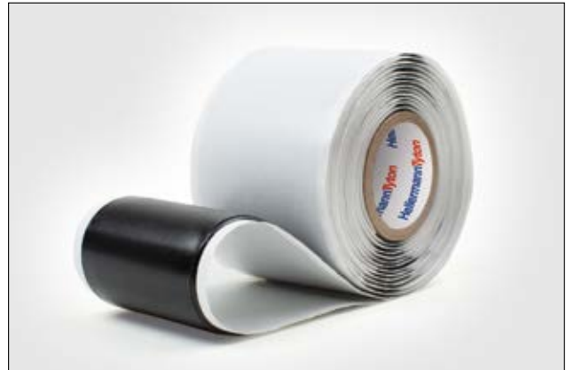
HelaTape Power 660 es una cinta de masilla de caucho flexible diseñada para el sellado y relleno de cables.