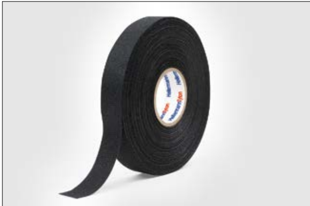
HelaTape Protect 300 cinta aislante textil, utilizada habitualmente como sistema antiruido.