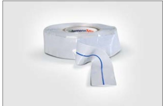
HelaTape Power 800 es una cinta de silicona autoamalgamante elástica con forma transversal triangular.