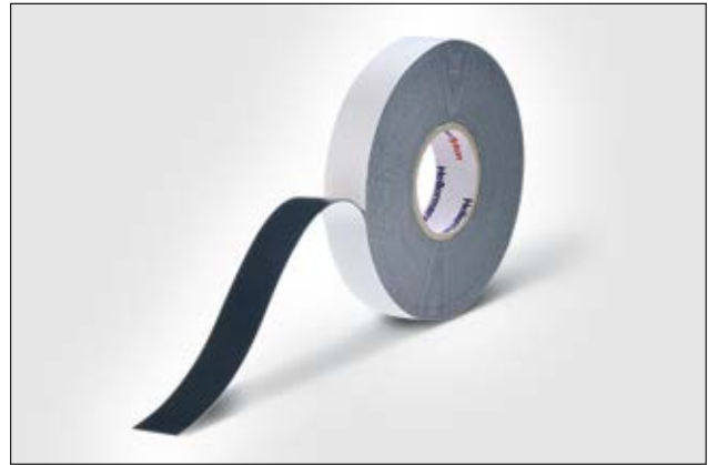
HelaTape Power 810 para aislamiento primario hasta 69 kV.