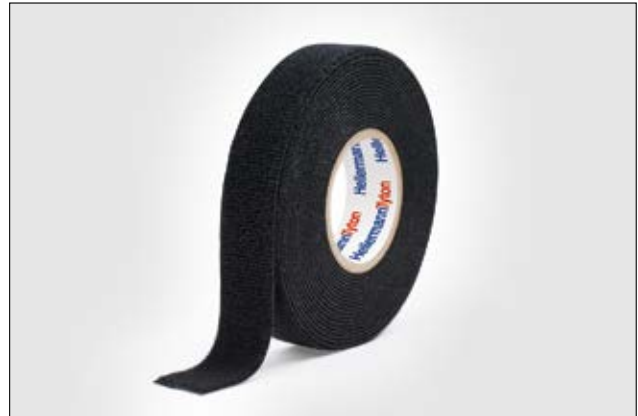
HelaTape Protect 1500 es tremendamente suave, ofreciendo una alta reducción de ruido.