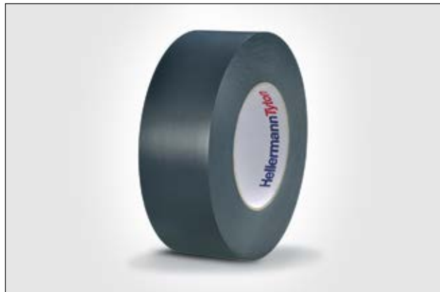
HelaTape Flex 25 con gran resistencia a la abrasión.