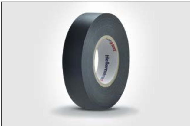
HelaTape Flex 20 - Espesor mayor que permite hacer capas rápidamente.