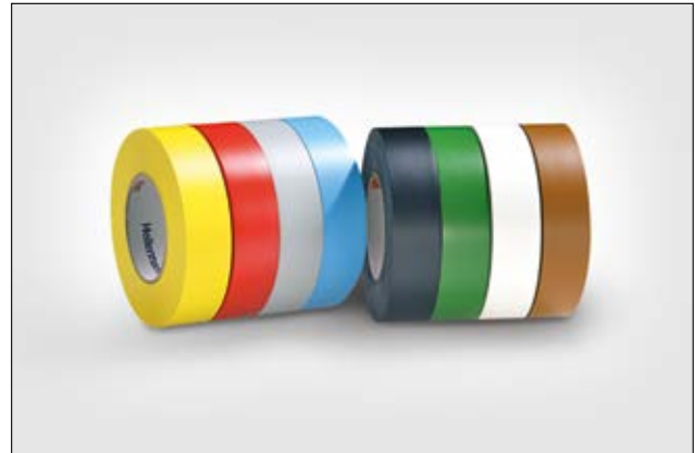
HelaTape Flex 1000+ proporciona un excepcional comportamiento a baja temperatura.